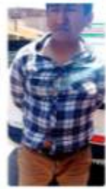
► Mucha preocupación de maristas a plena ebriedad.

Conductor en estado de ebriedad causó temor en la playa