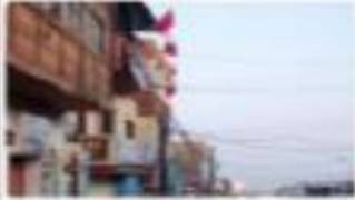
► Quiébrase el maltrato al comercio.

SEGÚN DECRETO DE ALCALDÍA N° 01-2019 Disponen embanderamiento de Mollendo ■ PÁG. 08