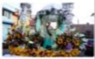
► Habrá concurso de bailes tradicionales con premios por $10 mil.

FOR ANIVERSARIO DE MOLLENDO Al menos 37 inscritos para el curso ■ PÁG. 08