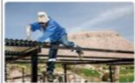
► La mejor forma de combatir pobreza.

Se ejecutan "Proyectos por Convocatoria" en Torata