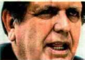
Alan García: libre