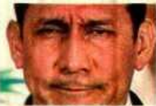
Humala: prisión preventiva