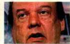
Alva Castro: libre