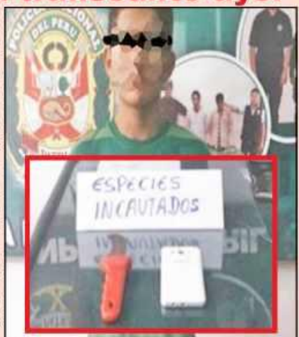
Menor de 16 años detenido ayer en Comisaría por robar celular.

El intervenido fue llevado a la comisaría del 21 de Abril para ser investigado.