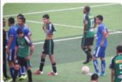
▶ Molleños se despiden de la departamental. ■ PÁG.08