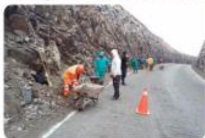
▶ Afectadas por las lluvias. ■ PÁG.09