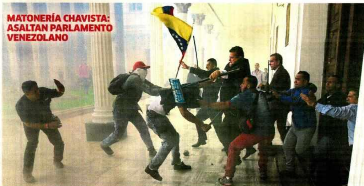
Chavistas encapuchados ingresan a la Asamblea: detonaron bombas en los jardines y luego, armados de palos y tubos, agredieron con violencia a los diputados y al público que participaban en la celebración del Día de la Independencia. Legisladores e invitados permanecieron secuestrados durante nueve horas. • PÁGS. 2-3-4