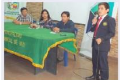
Fondo Editorial presenta dos nuevos ejemplares