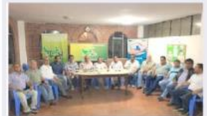
Transportistas amenazan con iniciar paro indefinido