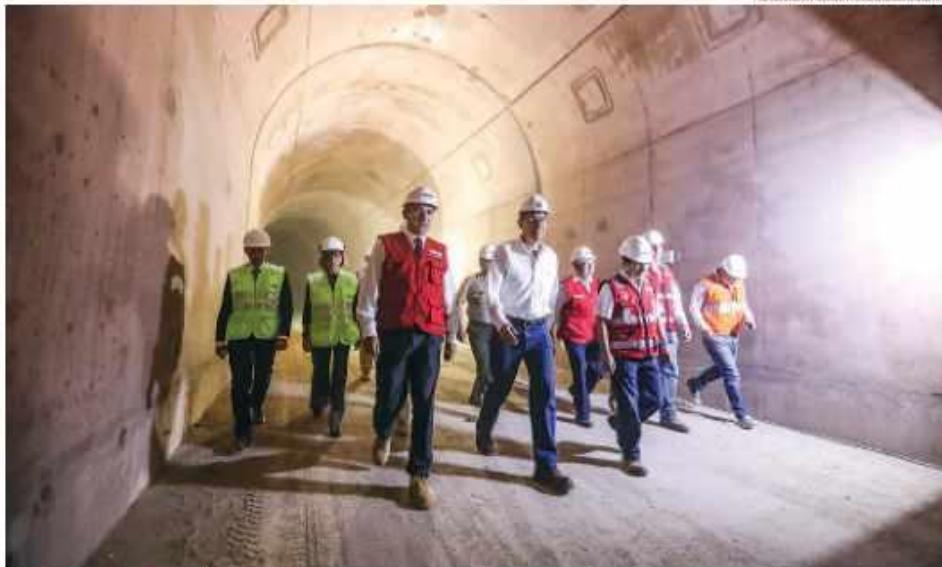
LÍNEA 2 DEL METRO ESTARÁ LISTA EL 2024 | El presidente Martín Vizcarra anunció ayer el adelanto de la culminación de la Línea 2 del Metro de Lima para el 2024, en beneficio de más de 2 millones de personas. Se tenía previsto entregar esta gran obra en el 2032. P. 2

●● Ministro de Economía, Carlos Oliva, estima una expansión de 4.2% para el próximo año, gracias a la dinamización de los proyectos mineros y de infraestructura que se activan. P. 6