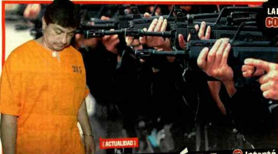
«ACTUALIDAD» Pág. 7

➔ FUE DETENIDO POR TRAFICAR DROGA EN INDONESIA