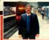
[INFORME] Pág. 4