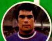
DE LA TORRE