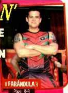
«EL FARÁNDULA» Págs. 8-9