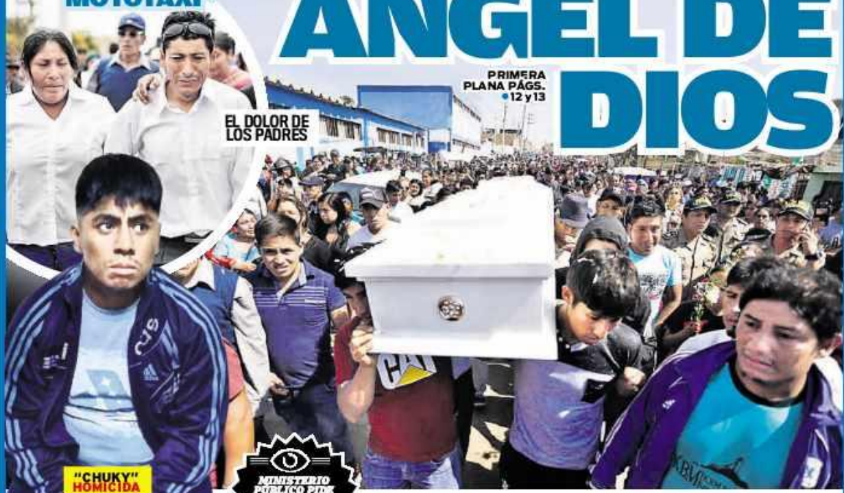
EL DOLOR DE LOS PADRES