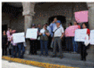
Secretaría del Sindicato denuncia que gobernador regional, los está obligando a trasladarse de forma prepotente y autoritaria. Páa. 7

Trabajadores del hospital iniciarán huelga indefinida