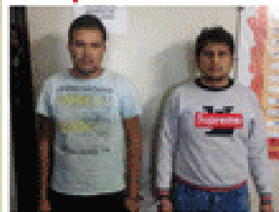
Transportaban más de 9 kilos de droga. El juez a cargo del caso ordenó el traslado inmediato de los dos imputados en el penal. Páa. 12

9 meses de prisión preventiva para traficantes de estupefacientes