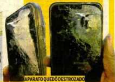
APARATO QUEDÓ DESTROZADO

Los cinco delincuentes huyeron a bordo de un auto y una moto lineal.