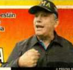
□ PÁGINA 8

Dice que están nerviosos y denuncia a mafias