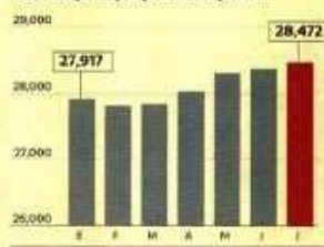
Crédito para pequeña empresa

El dato. Empleo formal aún no refleja mejoría de pequeñas empresas.