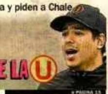
□ PÁGINA 14