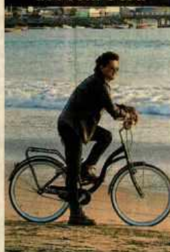
Carlos Vives muestra a Lima en un videoclip.