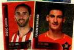
Álbum CRACKS de la Liga de Campeones