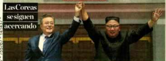
Kim Jong-un (der.) ofreció en la cita con Moon Jae-in cerrar más sitios nucleares y visitar Seul este año.