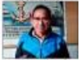
Desarrollando un estudio para el fortalecimiento de la gestión de la Oficina de Control Institucional de la DREL

“NOSOTROS QUEREMOS UNA CAPACITACIÓN REAL, NO UNA MENTIRA”