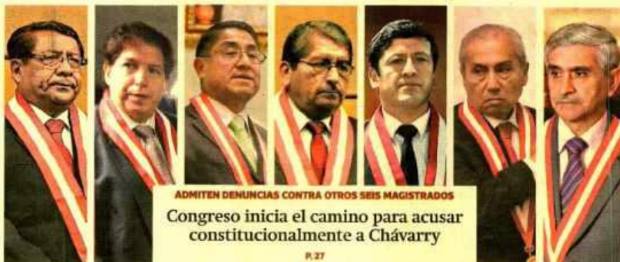
ADMITEN DENUNCIAS CONTRA OTROS SEIS MAGISTRADOS Congreso inicia el camino para acusar constitucionalmente a Chávarry

Pese al avance del mes pasado, en lo que va del año, salvo el Ministerio de Comercio Exterior y Turismo, el resto no ha ejecutado más del 50% de su presupuesto para obras. En los próximos meses, el incremento podría ser de solo un dígito. P. 2, 3