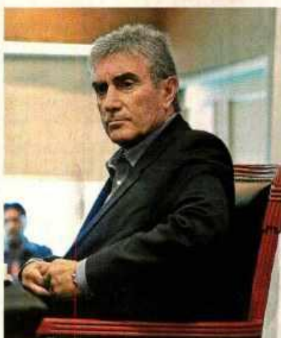
JUAN CARLOS OBLITAS

“Siento asco y pena porque han involucrado a la FPF”