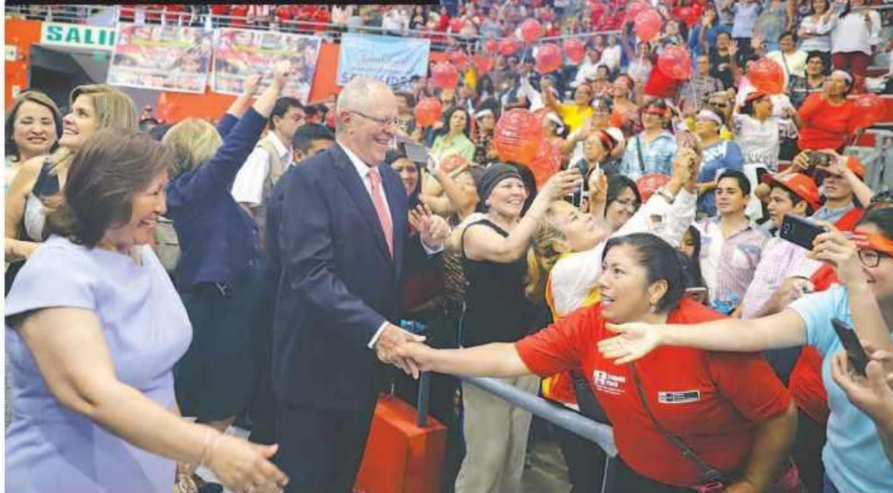
El presidente Pedro Pablo Kuczynski demandó el respeto a la mujer y asus derechos por la igualdad salarial, durante el Encuentro de la Mujer Peruana, celebrado en el coliseo D'ibós. P. 3

NORMAS LEGALES. AUTORIZAN TRANSFERENCIA DE PARTIDAS A FAVOR DE DIVERSOS GOBIERNOS LOCALES PARA LA DISTRIBUCIÓN DEL MONTO ADICIONAL DEL PROGRAMA DEL VASO DE LECHE. D. S. N.º 052-2018-EE