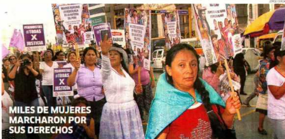
MILES DE MUJERES MARCHARON POR SUS DERECHOS

En Lima, regiones y en diferentes partes del mundo miles de mujeres marcharon para exigir que se respeten sus derechos y en contra del feminicidio, ola que en lugar de disminuir ha aumentado en Perú. La movilización fue en homenaje al Día Internacional de la Mujer. • PÁG. 18