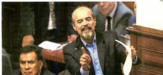
Según el aprista Mauricio Mulder, autor de la iniciativa, la norma permite el "equilibrio de poderes".

Críticas. Ministros no podrán ser ratificados tras la censura o el rechazo a una cuestión de confianza. Para expertos, es inconstitucional el procedimiento.