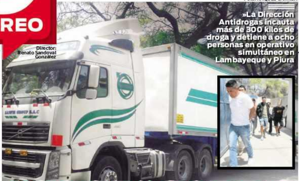
Director: Renato Sandoval González

»La Dirección Antidrogas incauta más de 300 kilos de droga y detiene a ocho personas en operativo simultáneo en Lambayeque y Piura