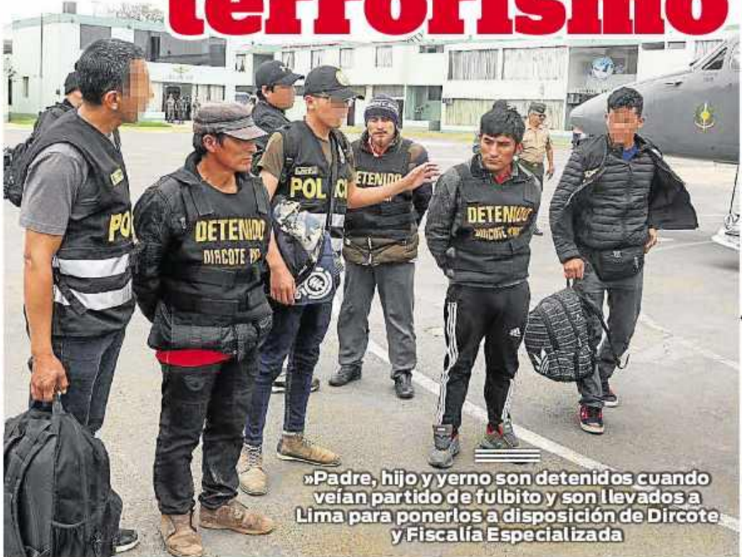
»Padre, hijo y yerno son detenidos cuando veían partido de fútbol y son llevados a Lima para ponerlos a disposición de Dircote y Fiscalía Especializada

989434481 | www.diariocorreo.pe | Precio S/0.70 | Año III N° 2271