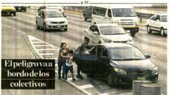
El peligro va a bordo de los colectivos

Envían cartas. Embajadora en el Reino Unido y ex secretario general fujimorista afirman que colaborarán con investigaciones.