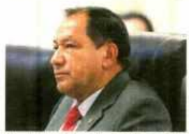
Yika criticó la "mal entendida disciplina" partidaria.

CONTINÚA EL ÉXODO NARANJA Bloque de Kenji Fujimori en el Congreso suma ya 12 integrantes