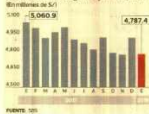
Evolución de créditos al sector construcción otorgados por la banca

El número. 20 regiones se afectarían si no se reemplaza el DU 003.