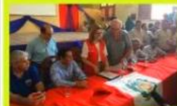
CON PRESENCIA DE PRIMERA MINISTRA MERCEDÉS ANÁOZ, MINISTRO Y CONGRESISTAS