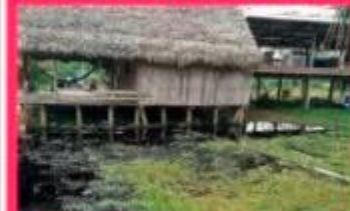
AFECTA A COMUNIDADES NUEVO NAZARETH Y JERUSALÉN