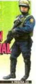
□ PÁGINA 18