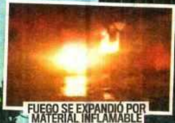
FUEGO SE EXPANDIÓ POR MATERIAL INFLAMABLE

VELA DESATA TRAGEDIA EN QUINTA DE LA VICTORIA