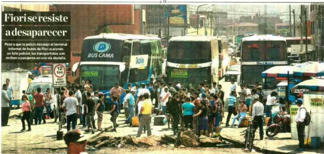
Las instalaciones que funcionaban desde 1991 en el terreno de 6.000 m 2 en San Martín de Porres fueron demolidas. No obstante, los vehículos siguen recogiendo a pasajeros en la calle Miguel Ángel.

Pese a que la policía desalojó el terminal informal de buses de Fiori acatando un fallo judicial, los transportistas aún reciben a pasajeros en una vía aladaña.