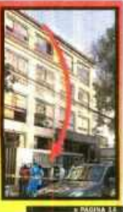
□ PÁGINA 14