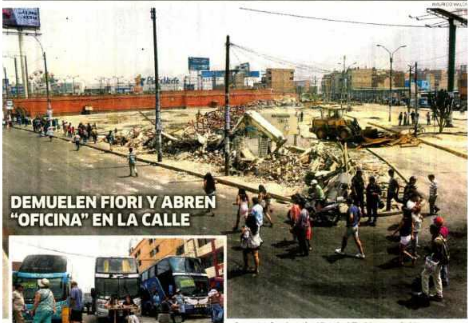
DEMUELEN FIORI Y ABREN “OFICINA” EN LA CALLE