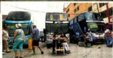
Cuarenta años después el Terminal Fiori, lugar preferido por los viajeros al norte, fue demolido. De inmediato, las empresas comenzaron a vender pasajes en las calles adyacentes. • PÁG. 19

POLÍTICA • PÁG. 7 García Belaunde y Morales piden que Comisión Lava Jato cite a esposo de la legisladora Letona