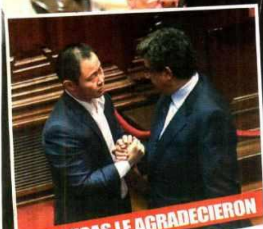
PPKAUSAS LE AGRADECIERON

Pedro Pablo Kuczynski @ppkamigo Peruanos. Mañana empieza un nuevo capítulo en nuestra historia: reconciliación y reconstrucción de nuestro país. Una sola fuerza, un solo Perú.