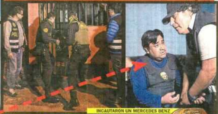
INCAUTARON UN MERCEDES BENZ

HERMANO DE ALCALDE DE VILLA MARÍA DEL TRIUNFO SE HIZO RICO COBRANDO CUPOS A EMPRESAS, MERCADOS Y DISCOTECAS