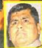
ÁNGEL CHILINGANO (ALCALDE DE VMT)