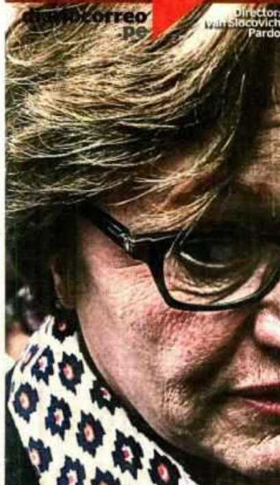
Director: Walter Slocovich Pardo

Cae banda de extorsionadores liderada por hermano del alcalde de VMT