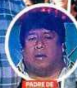
PADRE DE VÍCTIMAS