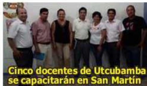
Cinco docentes de Utcubamba se capacitarán en San Martín