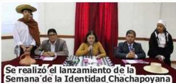
Se realizó el lanzamiento de la Semana de la Identidad Chachapoyana