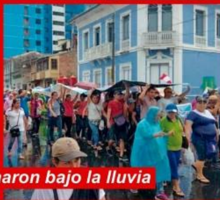
Profesores marcharon bajo la lluvia