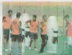
Juan Aurich volverá a jugar en el estadio de Olmos