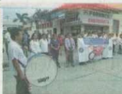
Médicos suspendieron huelga tras acuerdo con el Minsa