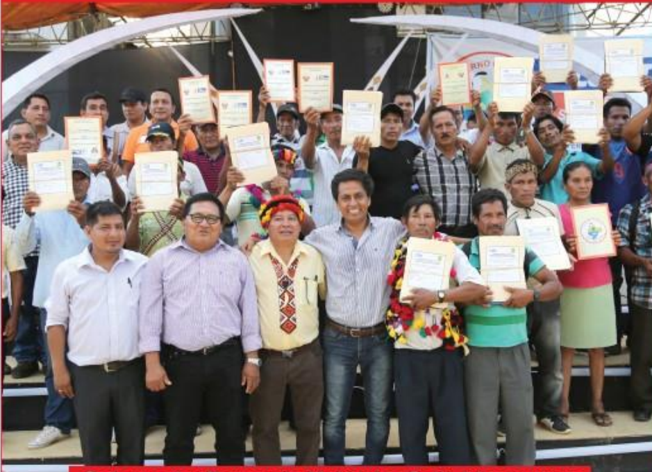
Gobernador Fernando Meléndez Celis hizo entrega de títulos de propiedad junto a autoridades

Entregan mil títulos de propiedad rural y 34 resoluciones de comunidades nativas