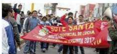
¡HABRÁ SOLUCIÓN! Maestros ayer siguieron en las calles.

Amenazan. Dirigente asegura que si hoy no resuelven sus pedidos, desde el lunes tomarán otras acciones. ● Pág. 8