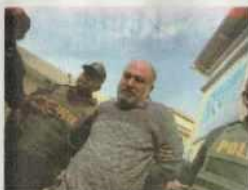
Poder Judicial pide informe al INPE sobre el caso Torres