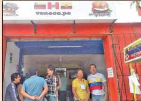
Más de 300 venezolanos participaron ayer en consulta popular.

No desdichan realidad de su país. Un promedio de 300 ciudadanos venezolanos que se encuentran radicados en la provincia del santa, en condición de migrantes, sufragaron la mañana de ayer en nuestra ciudad como parte del proceso de Consulta Popular convocada en su país por la asamblea nacional por respetar o rechazar la modificación de la Constitución propuesta por la dictadura de Nicolás Maduro. El acto electoral se realizó en un inmueble ubicado frente a la plaza Mayor de Nuevo Chimbote, hasta donde fueron convocados los matriculados del país llanero que han llegado a nuestra ciudad fugados de las miserias y carencias que padecen en su país. Los organizadores de este acto electoral señalaron que en el país hay un promedio de 70 mil venezolanos que han mirado a nuestro país especialmente en los últimos años, por ello ayer se desarrolló esta consulta popular en Lima, Arequipa, Trujillo y Chimbote, con la finalidad de recoger el voto soberano de