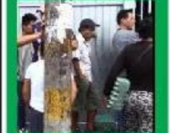
COMERCIANTE SE QUEJA