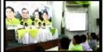
FUERON PRESENTADOS OFICIALMENTE